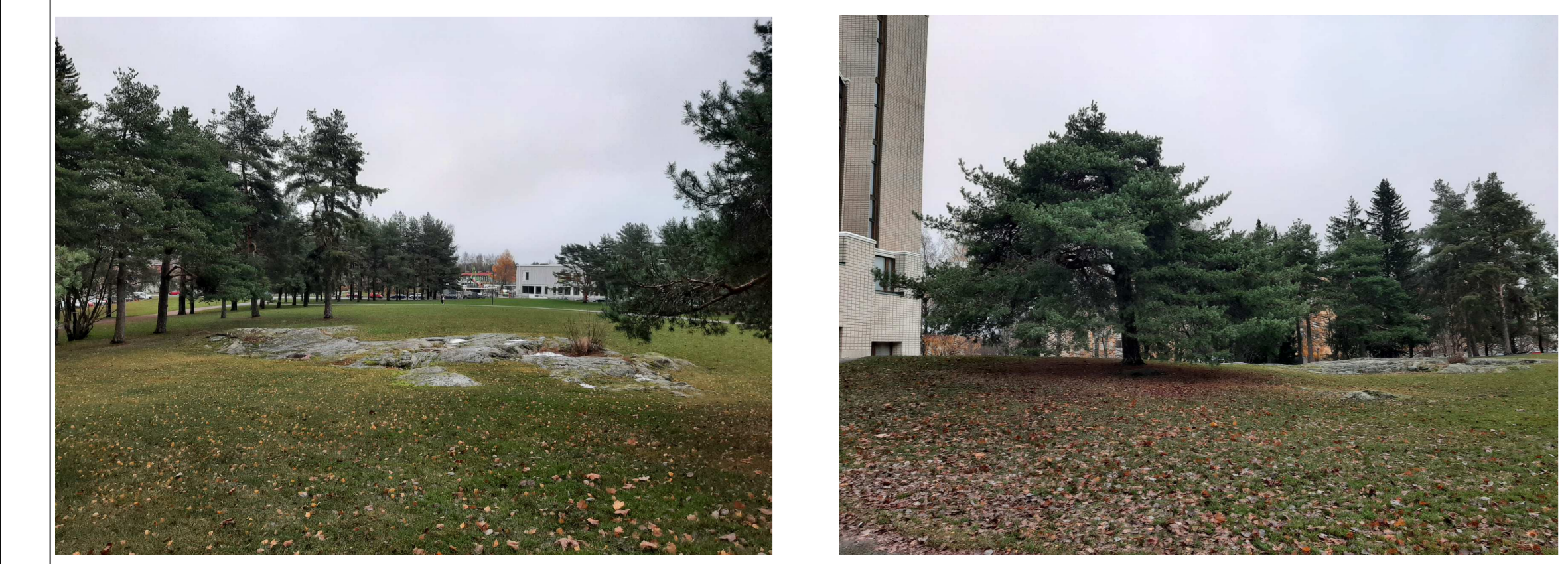
Liisanpuiston kalliokumpareen nykytilaa, ennen paahdekedon perustamista. Niityn perustamisen yhteydessä avokalliota otetaan hieman lisää esille ja kaikki olevat puut, yhtä koivua lukuunottamatta säilytetään. Kallion kupeeseen, niityn näköalapaikalle lisätään myös muutama yksittäispenkki.