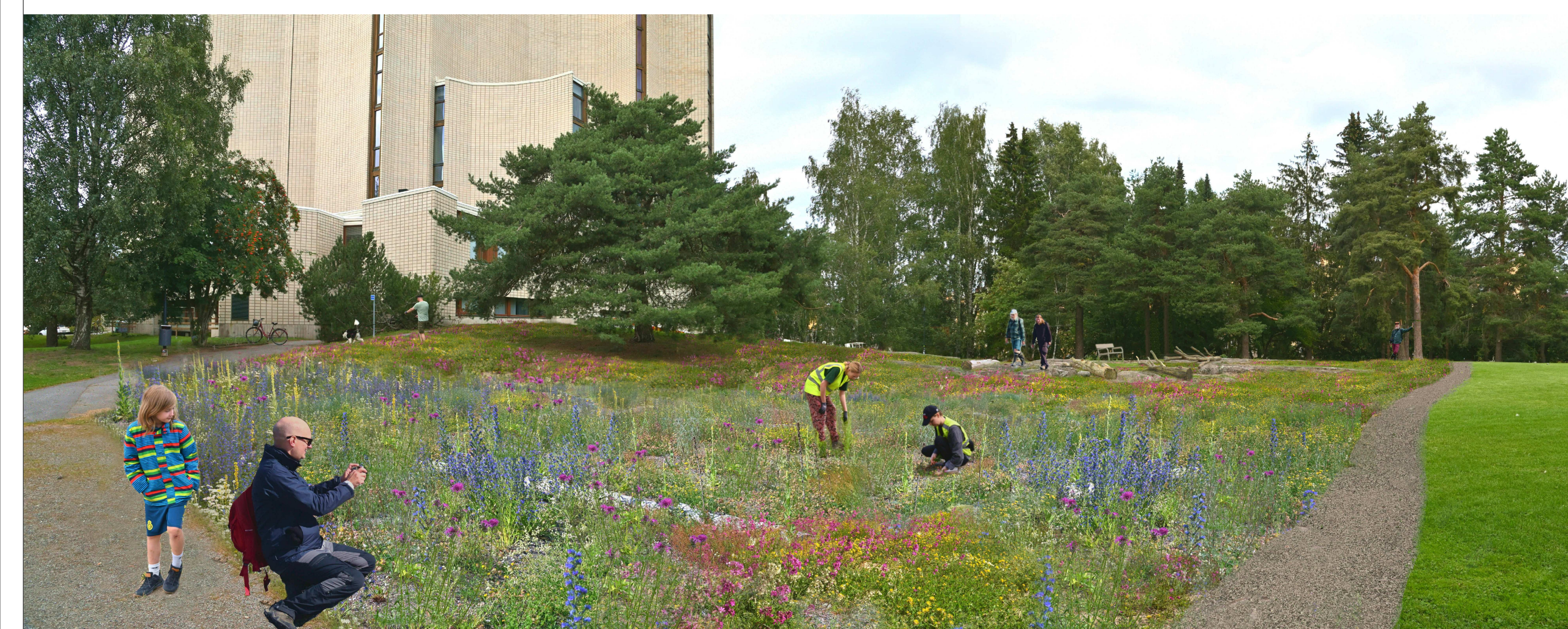
Havainnekuva paahdekedolle kaakosta kohti Kalevan kirkkoa. Keto tarvitsee intensiivistä hoitotyötä noin viiden vuoden ajan ennen kuin se alkaa näyttää kuvan mukaiselta. Alueella kuljetaan vain polkuja ja avokallio-alueita pitkin.

HUOM! Puiden, istutusten, kalusteiden ja varusteiden sijaintipaikat ja määrät ovat ohjeelliset ja ne tarkentuvat rakennussuunnittelun aikana.