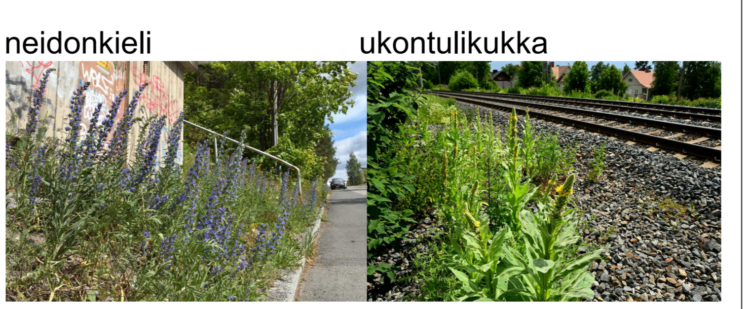
Esimerkkejä Kalevanharjun luonnonkasveista, joiden siemeniä katon perustamiseen käytetään.