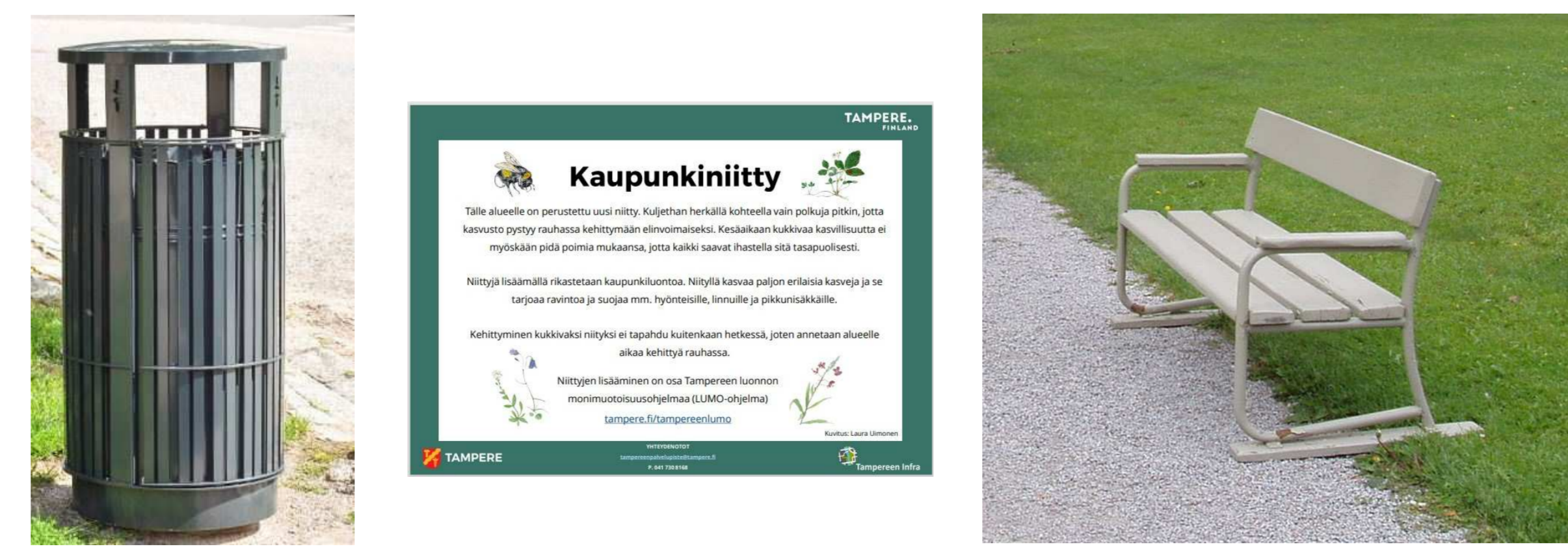
Liisanpuiston roskakorit vaihdetaan isompaan, muotoilultaan linjakaampaan malliin. Alkuperäinen, kulttuurihistoriallisesti merkittävän Liisanpuiston penkkimalli säilytetään ja samasta mallista tehdään myös esteettömämpi yksittäispenkki käsinojilla. Valaisinpylväisiin kiinnitetään info-kyltit kertomaan paahdekedosta.