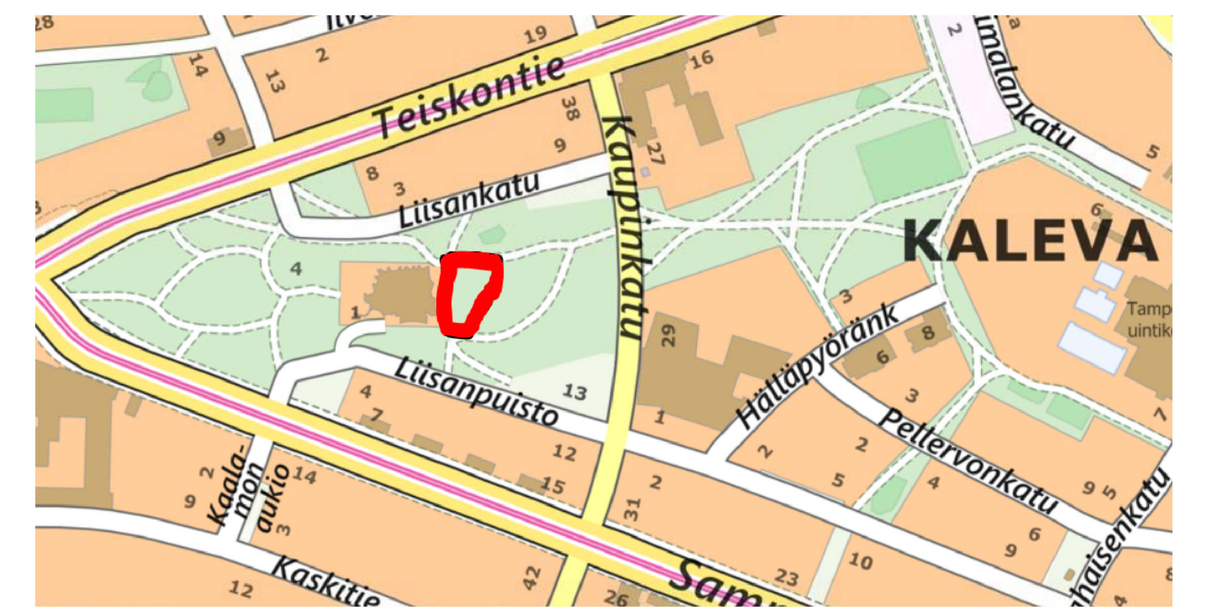
Tässä suunnitelmassa on käytetty ETRS-GK24/N2000 taso- ja korkeuskoordinaatistoa